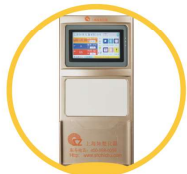
7 寸真彩触摸屏 白板设计透明插页框